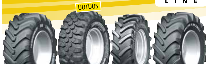
MICHELIN XMCL MICHELIN BIBLOAD HARD SURFACE MICHELIN XM27 MICHELIN XM47