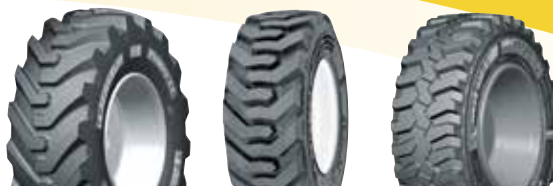
MICHELIN POWER CL MICHELIN BIBSTEEL AT MICHELIN BIBSTEEL HS