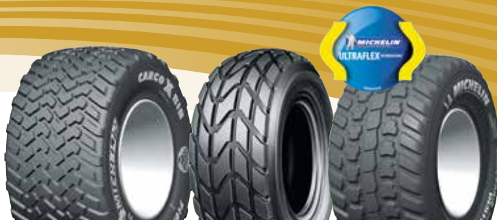
MICHELIN CARGOXBIB MICHELIN XP27 MICHELIN CARGOXBIB HIGH FLOTATION