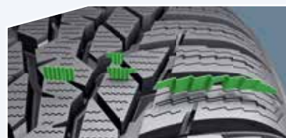
Anvelope Nokian cu caneluri optimizate în blocuri

Nokian WR D4 este un campion al aderenței ale cărei inovații unice permit șofatul în siguranță și cu stabilitate și pe șoselele ude și pe cele acoperite de zăpadă. Este prima anvelopă de iarnă din lume de calitate superioară care oferă o aderență pe carosabil umed care o încadrează în cea mai bună clasă A din UE.